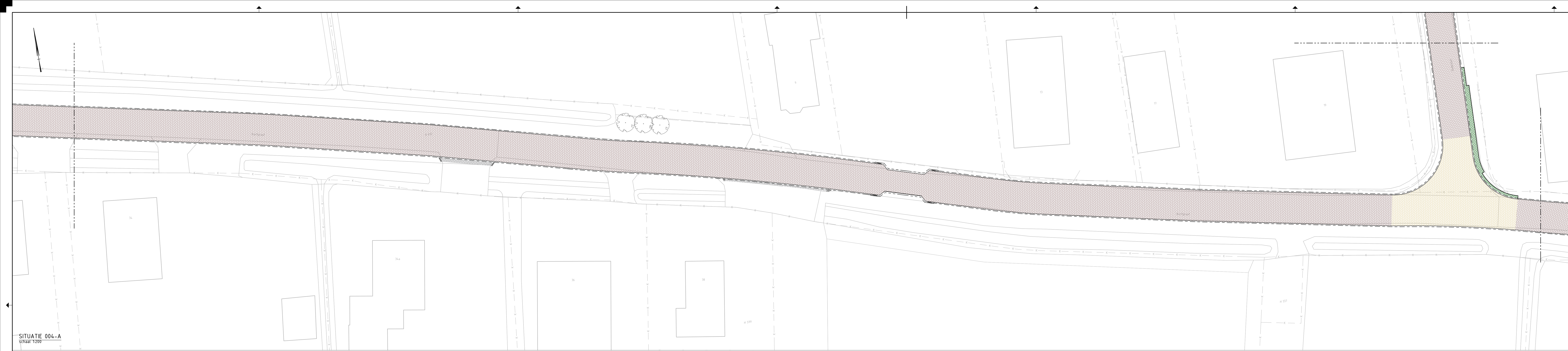
SITUATIE 004-A Schaal 1:200